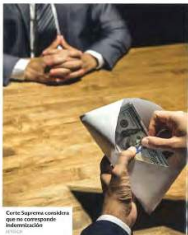
Corte Suprema considera que no corresponde indemnización