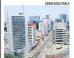
Empresas. Prefieren financiarse en moneda nacional.

Resalta que empresas no corporativas siguen accediendo al financiamiento en el mercado a través del Mercado Alternativo de Valores (MAV), beneficiándose de las ventajas que ofrece este segmento. Así, Agrícola y Ganadera Chavín de Huancayo realizó tres colocaciones de instrumentos de corto plazo por un total de US$ 1.6 millones, y Larí Contratistas emitió un título similar por US$ 1 millón.