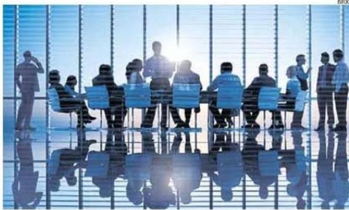
Ejecutivos. Multas por incumplir prohibiciones planteadas por SMV podrían llegar a S/ 230,000.

Se entiende por información privilegiada sobre una empresa a la no divulgada al mercado y que podría afectar el precio o la liquidez de sus va-